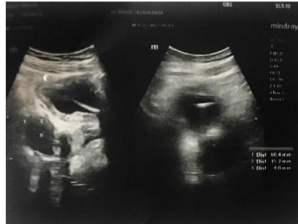
شکل ۱. ناحیه اکوژن خطی مایل به طول ۷۱ میلی‌متر مطرح کننده جسم خارجی داخل مثانه

احتمال جسم خارجی مطرح شده بود (شکل ۱). در ادامه به متخصص ارولژی ارجاع شد بعد از بستری گرافی لگن انجام شد که هیچ یافته‌ای مشاهده نشد (شکل ۲). بدنبال آن در سی‌تی‌اسکن اسپیرال شکم و لگن بدون تزریق و بدون کنتراست خوراکی تصویر جسم خارجی در مثانه مسجل شده (شکل ۳ و ۴) و بیمار کاندید سیستوسکوپی شد.