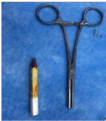
شکل ۶. عکس مداد خارج شده از مثانه

در سیستوسکوپی انجام شده ابتدا نکته ای مشاهده نشد ولی در ادامه بررسی جسم خارجی در سقف مثانه با دقت بیشتر مشاهده شد. از آنجا که امکان خروج به راحتی ممکن نبود. ابتدا با سنگ شکن مکانیکال نوک مداد را شکسته سپس با گرسپر از سوراخ نوک مداد بطور طولی بدون تروما به مجرا خارج شد (شکل ۶).