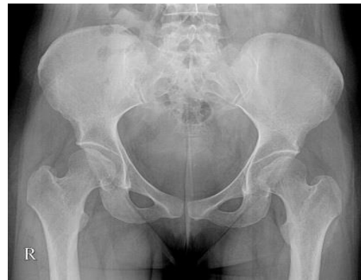
شکل ۲. گرافی لگن